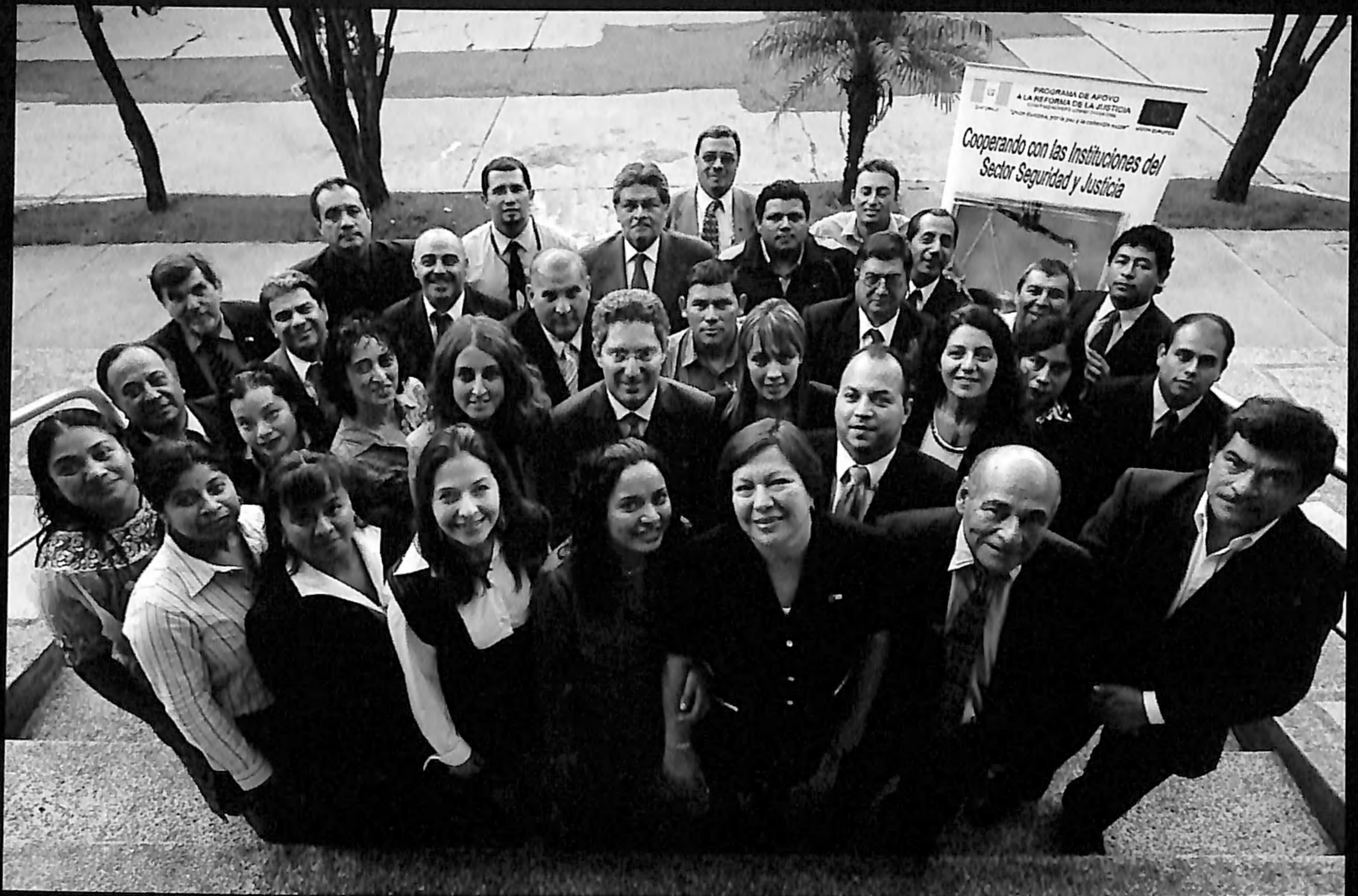
El equipo de trabajo del Programa de Apoyo a la Reforma de la Justicia de la Unión Europea (PARJ).